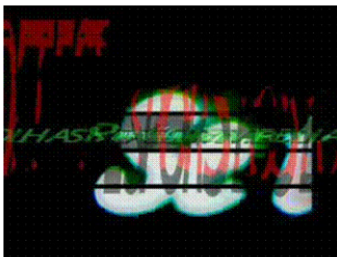
Wilton Azevedo - Interpoema Lado Incerto - 2004