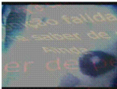
Wilton Azevedo - Interpoema Amal Gama 2004