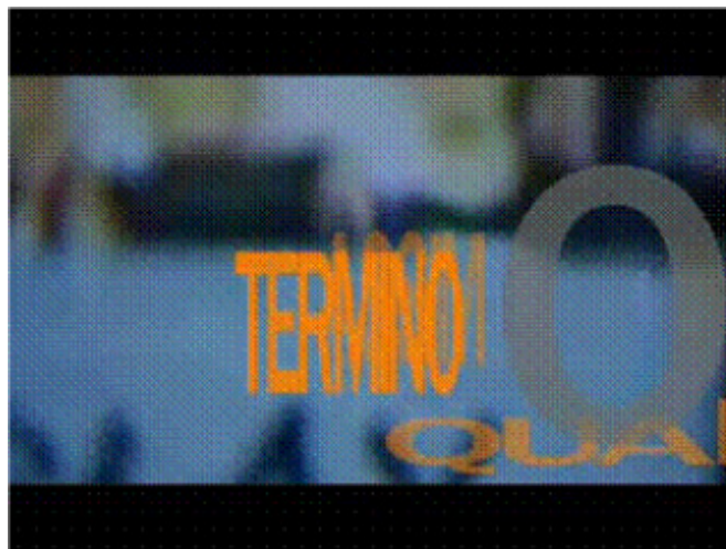
Wilton Azevedo - Quando Assim Termino o Nunca... - 2004