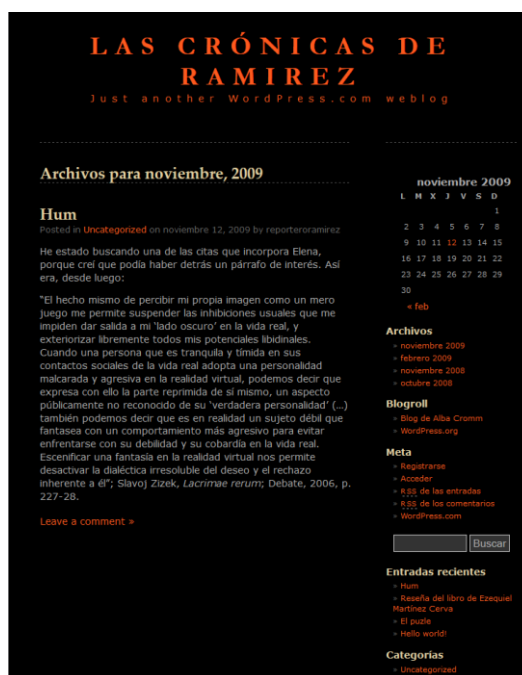
Imagen 2 – Captura de pantalla del blog “Las Crónicas de Ramírez”