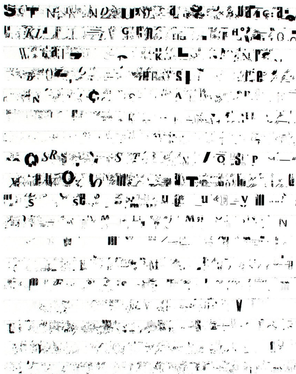
Fig. 1 – “A Noite Acontece” (Ensaio para Homeóstato Visual # 1) [Fita adesiva e Letter-Press sobre papel Cotman 425 gr. | 76x56 cm | 2015]