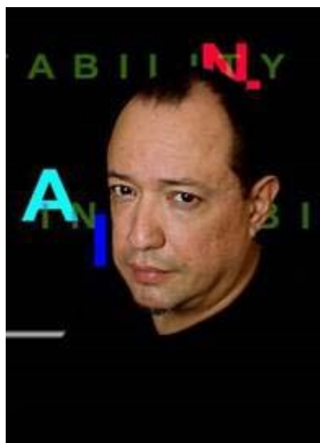
Fig.1 – Wilton Azevedo