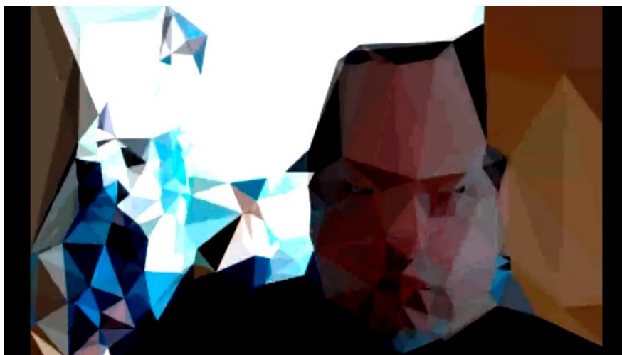
Fig. 2 – Imagem do vídeo Encéfalo , Wilton Azevedo, 2013