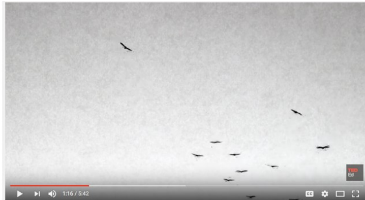
Fig. 2 – Abutres vigiam as deslocções dos refugiados.