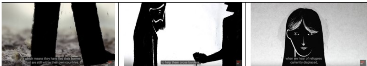
Fig. 4 – Variação na visualização das personagens: de espetadores a testemunhas.