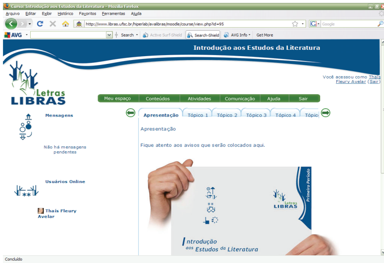
Figura 1 – AVEA no curso de Letras-LIBRAS e uma disciplina de Literatura.