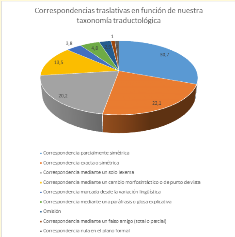
Tabla 10: Datos estadísticos relativos a las correspondencias traslativas

tanto de su formación traductológica como de su sensibilidad ante cuestiones lingüísticas, culturales y pragmáticas. En el gráfico que mostramos a continuación, se presentan los datos recabados a nivel estadístico sobre la base de nuestra taxonomía: